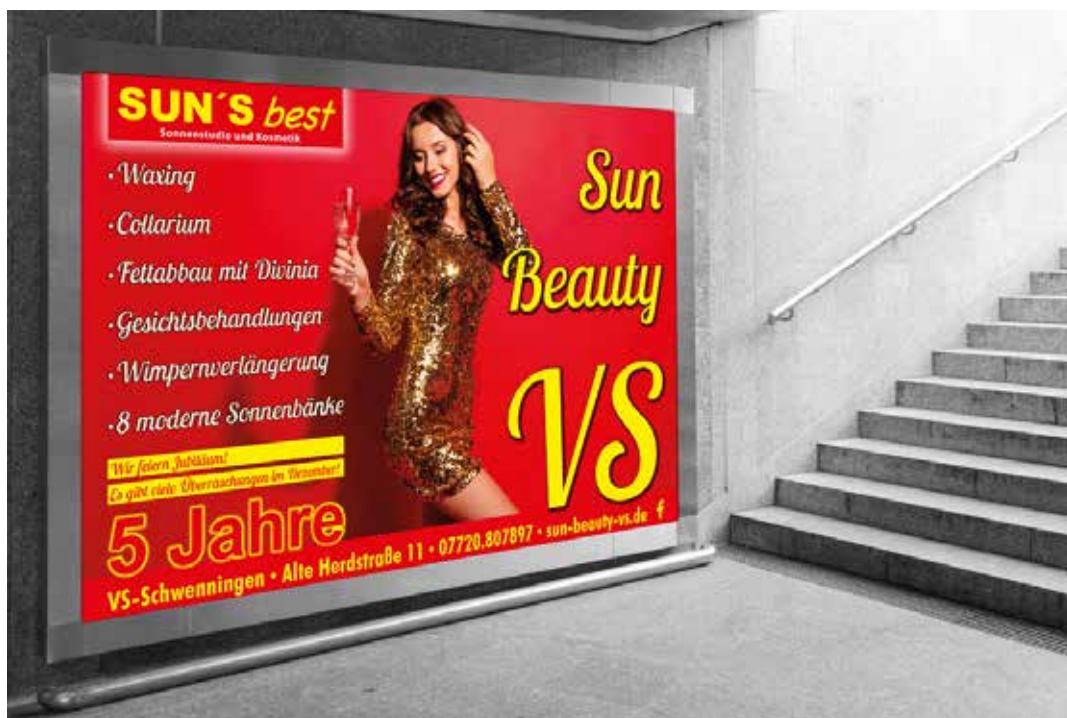
Großflächenplakat im Auftrag von www.sun-beauty-vs.de