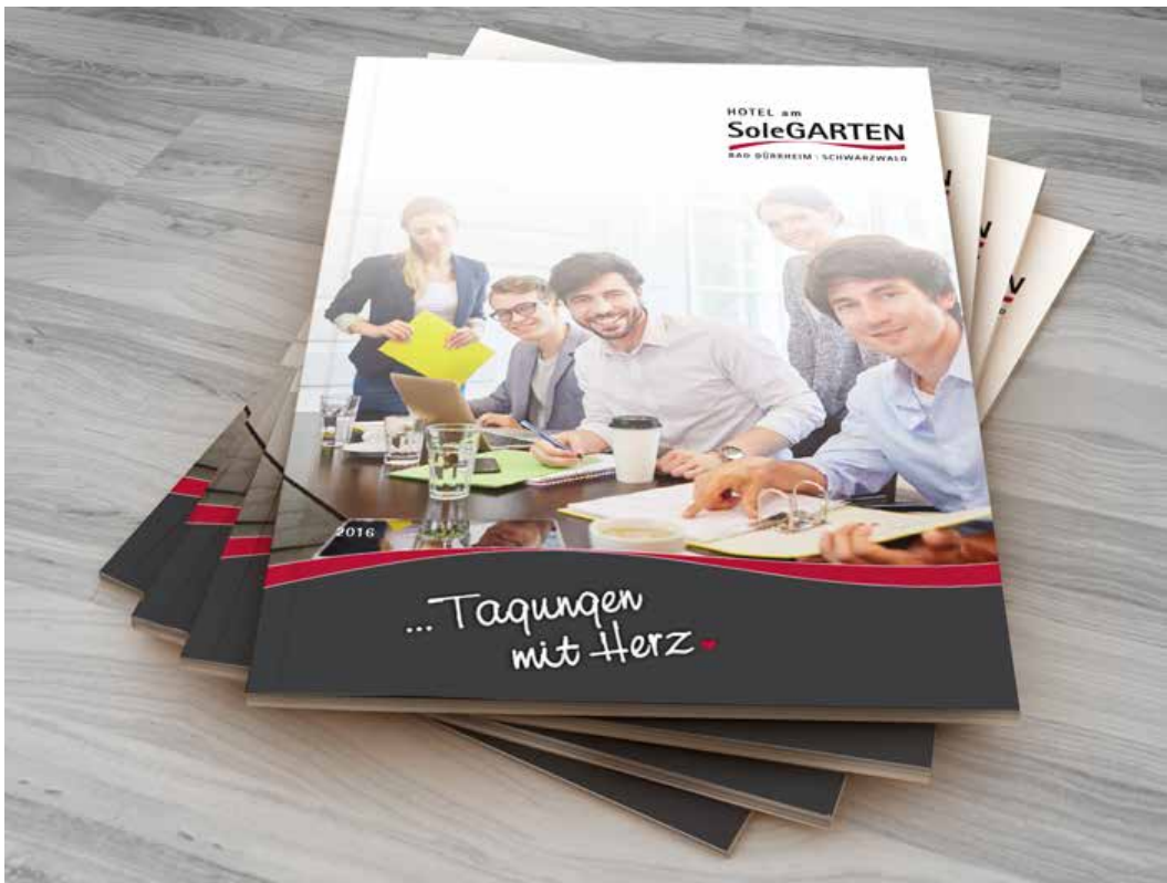
Magazin 24 seitig im Auftrag von www.solegarten.de