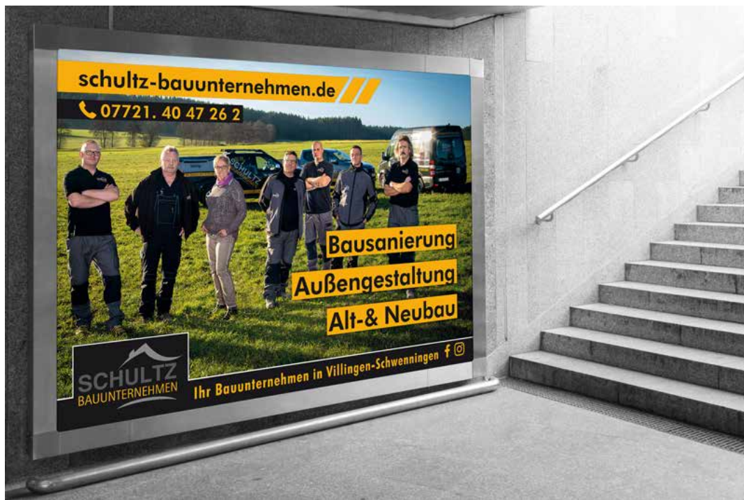
Großflächenplakat im Auftrag von www.schultz-bauunternehmen.de