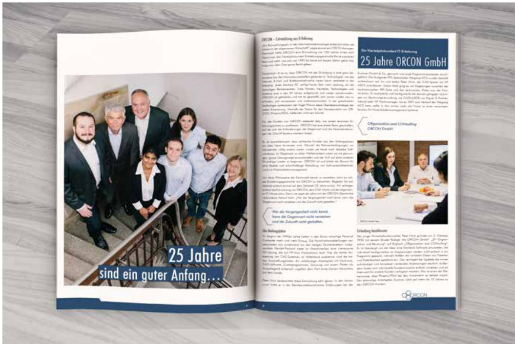
Magazin 48 seitig im Auftrag von www.orcon.de